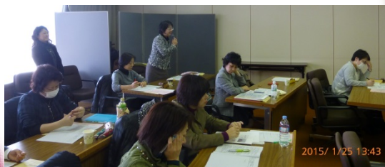
実践報告会の様子