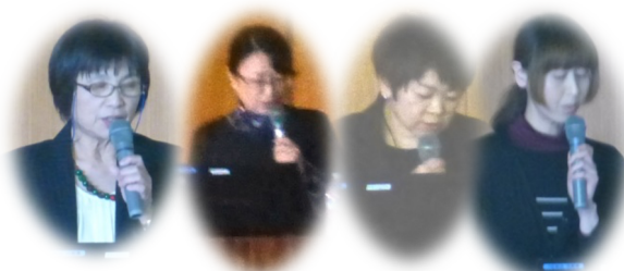
実践報告会 演者のみなさん